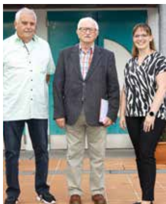
> Die geehrten Kollegen (Ehrenzeichen sowie Ehrenzeichen am Bande) sowie die Vorsitzende der Standortgruppe

Im Rahmen der diesjährigen Hauptversammlung standen jedoch vor allem die turnusmäßigen Neuwahlen des Vorstandes, Ehrungen, Abstimmung über Anträge an die kommende Bereichsversammlung sowie die Entsendung der Delegierten für die Bereichsversammlung 2024 im Mittelpunkt.