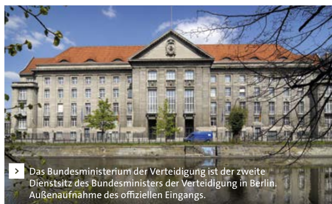
Das Bundesministerium der Verteidigung ist der zweite Dienstsitz des Bundesministers der Verteidigung in Berlin. Außenaufnahme des offiziellen Eingangs.

für ihn erarbeiten. Alle Vorlagen aus dem BMVg an die politische Leitung des BMVg und an den GI sollen bewertet sowie inhaltlich und qualitativ gesteuert werden. Die Vorla-