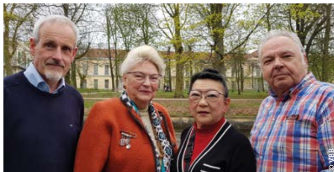
> Berliner Senioren vor dem Park des Schlosses Charlottenburg

In einer Grußadresse des Vorsitzenden des Bereiches VIII, Kollege Wolfgang Bernath , und des Sprechers der Ruhestands-