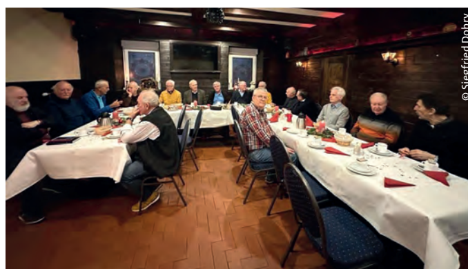
> Blick in die Runde

So fand die Weihnachtsfeier nach einem kurzweiligen und recht unterhaltsamen Nachmittag schließlich ihr Ende.