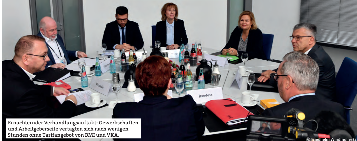
Ernüchternder Verhandlungsaufakt: Gewerkschaften und Arbeitgeberseite vertagten sich nach wenigen Stunden ohne Tarifangebot von BMI und VKA.