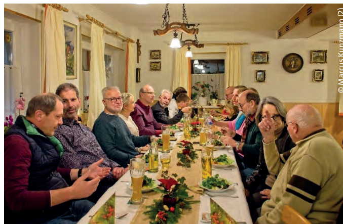
► VBB-Mitglieder und Ruhestandsbeamte bei intensiven Gesprächen

Die Mitglieder der StOGrp. trafen sich mit Familie im Gasthof Sternen, der in Nusplingen, einem Teilort von Stetten a. k. M., liegt. Begonnen wurde die Feier auf der Kegelbahn, dort hatten Groß und Klein ihren Spaß.