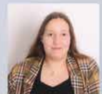
Celine Leher RSA'in, BwDLZ Bogen