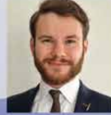
André Saltymakov Refd, BAAINBw