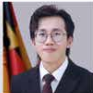
Do Sang Hoang RSA, BwDLZ Amberg