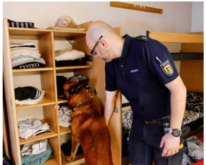
Die Gefangenen bekommen immer Bescheid, wenn in ihrem Haftraum eine Kontrolle stattgefunden hat.