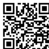
Hinweise für den Stufenaufstieg

Der VBB weist ergänzend zum Erlass darauf hin, dass ein vorgezogener Stufenaufstieg – entgegen der bisher gängigen Praxis – auch vor dem Erreichen der Hälfte der regulären Stufenlaufzeit möglich ist . Weitere Hinweise zum Stufenaufstieg entnehmen Sie bitte den QR-Codes.