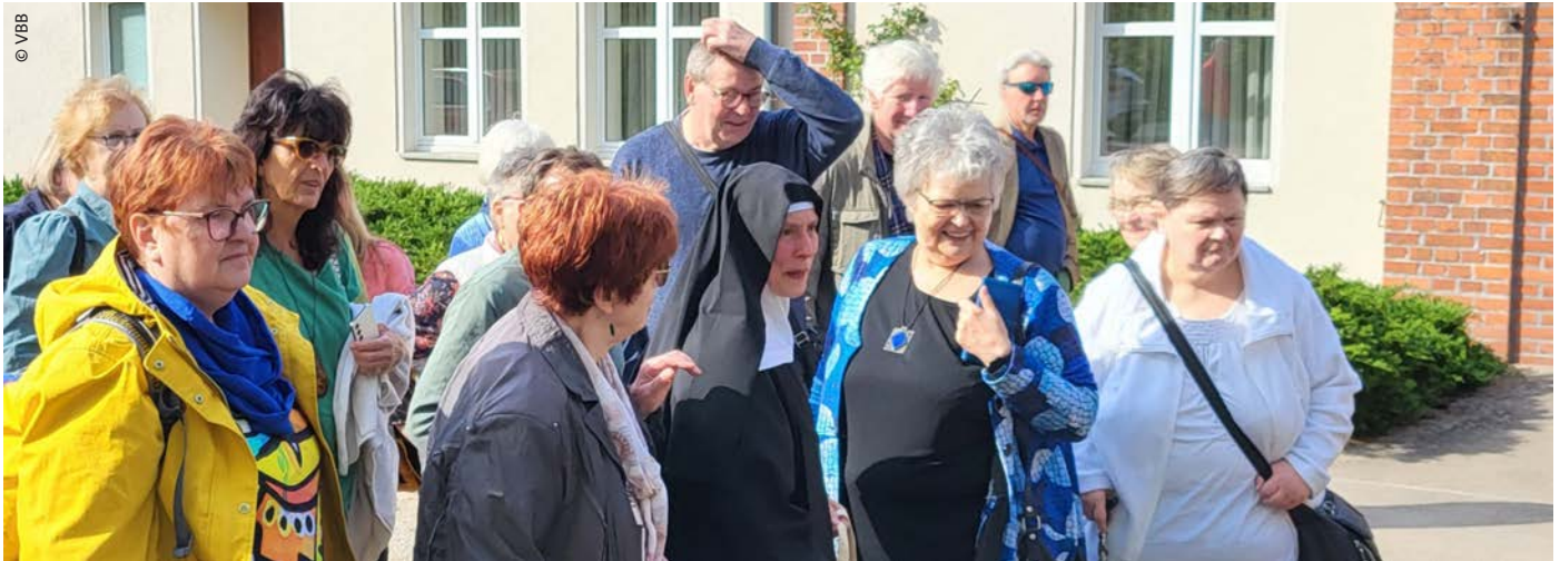
Senioren der VBB-Bereiche VII und VIII zu Besuch im Kloster Alexanderdorf

möglichen Selbstversorgung der Gäste. Die Abtei St. Gertrud ist ein sehr gastfreundliches und erstaunlich „zeitgemäßes“ Kloster.