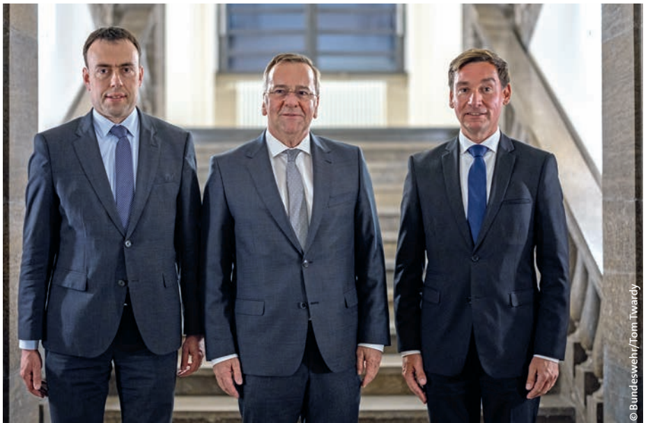
Bundesminister der Verteidigung, Boris Pistorius (Mitte), stellt sich zum Gruppenbild mit den beiden neuen parlamentarischen Staatssekretären Dr. Nils Schmid (links) und Sebastian Hartmann im Bundesministerium der Verteidigung in Berlin am 6. Mai 2025 auf.

Die Ernennung erfolgte im Zusammenhang mit der Wahl von Herrn Friedrich Merz zum Bundeskanzler. Nach dessen Wahl im Bundestag erhielten alle Mitglieder der neuen Bundesregierung ihre Ernennungsurkunden durch Bundespräsident Frank-Walter Steinmeier und legten im Anschluss ihren Amtseid ab.