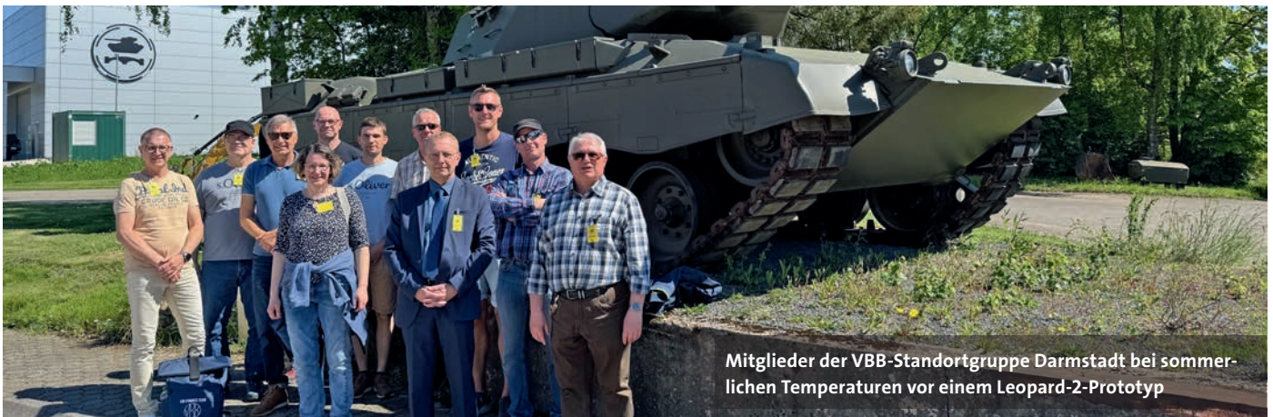
Mitglieder der VBB-Standortgruppe Darmstadt bei sommerlichen Temperaturen vor einem Leopard-2-Prototyp