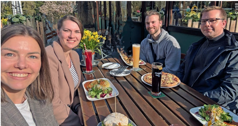
Die Jugend der Standortgruppe Kiel

Am 8. April 2025 war es so weit: Nach längerer Pause gab es wieder ein Lebenszeichen aus dem Jugendbereich der Standortgruppe Kiel. Beim ersten „Meet and Greet“ im Restaurant Forstbaumschule kamen einige junge Mitglieder zusammen, um sich bei bestem Wetter, kühlen Getränken und leckerem Essen in entspannter Atmosphäre kennenzulernen und auszutauschen.