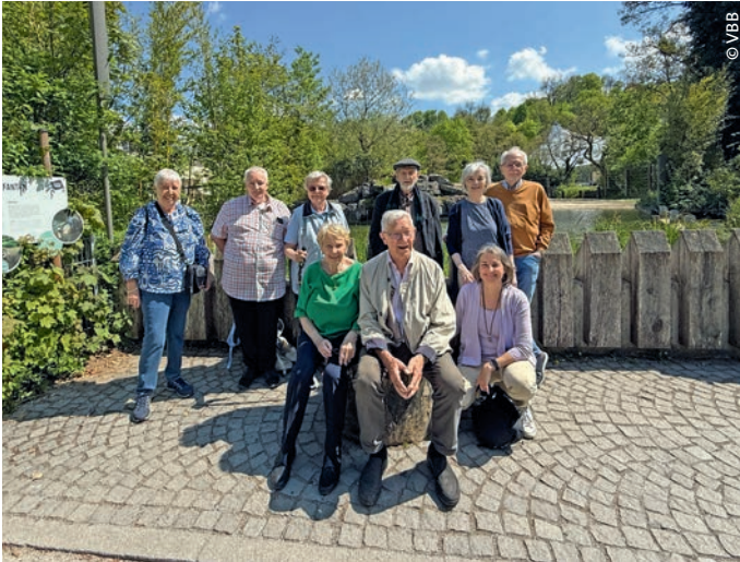
Mitglieder der Standortgruppe München/Fürstenfeldbruck im Tierpark Hellabrunn