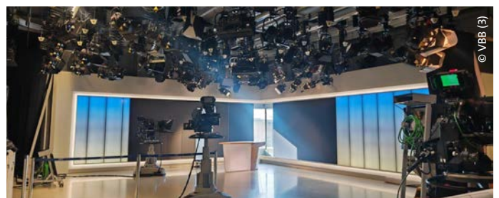
Im Fernsehstudio zwischen den Liveschaltungen mit allgemein bekannter Kulisse