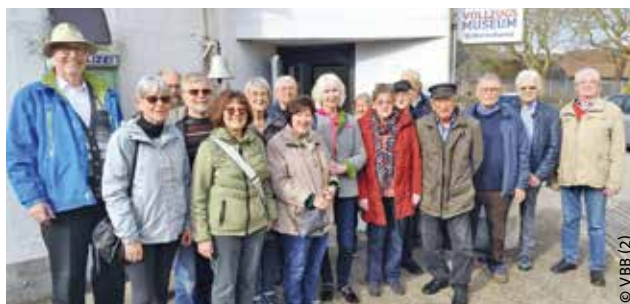
Ruheständler der Standortgruppe Wilhelmshaven im Gruppenbild

Die Ruheständler der beiden VBB-Standortgruppen – insgesamt 43 Personen – genossen den Grünkohl bei einem Essen am 28. März 2025 im Wilhelmshavener Gorch-Fock-Haus. Die Grp. I konnte bei diesem Anlass zwei Mitglieder für 50 beziehungsweise 60 Jahre Mitgliedschaft ehren. Wie jeden 2. Dienstag im Monat um 16.00 Uhr, so auch im März, trafen sich die Ruheständler der beiden Standortgruppen zum Stammtisch im Offizierheim. Die Teilnehmerzahl lag jeweils bei 20 bis 30 Mitgliedern. Am 24. März besuchten 17 Personen das Wilhelmshavener Vollzugsmuseum und hörten gespannt den interessanten Ausführungen des 1. Vorsitzenden des Fördervereins, Herrn Cramme, zu.