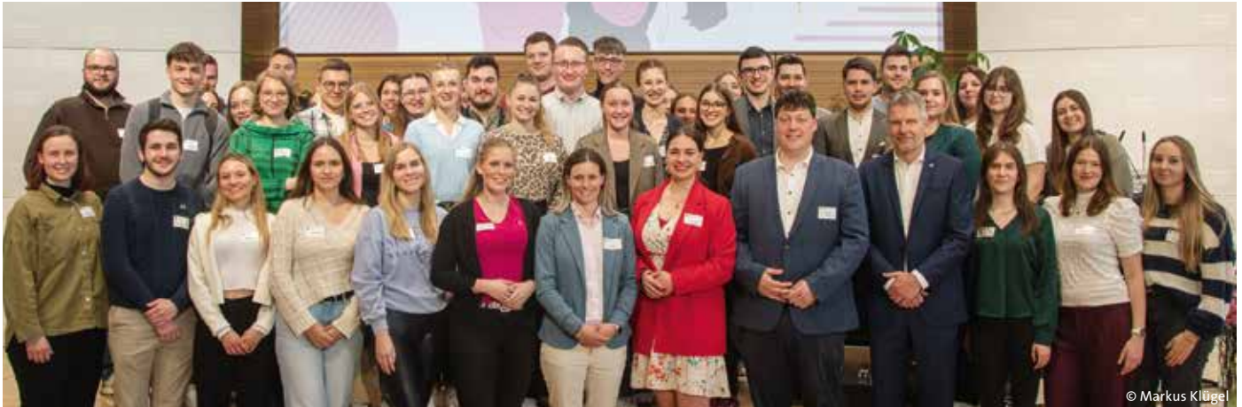
Teilnehmende des dbbj-Ideencampus 2025 im dbb forum berlin

Die Demokratie steht unter Druck, auch in Deutschland – deshalb hat die dbb jugend sie auf dem Ideencampus 2025 in den Fokus gerückt. Unter dem Motto „Von Müdigkeit zur Mitwirkung. Demokratie neu beleben“ diskutierten am 10. April 2025 junge Beschäftigte aus dem öffentlichen Dienst über Zukunftsperspektiven für Staat und Gesellschaft.