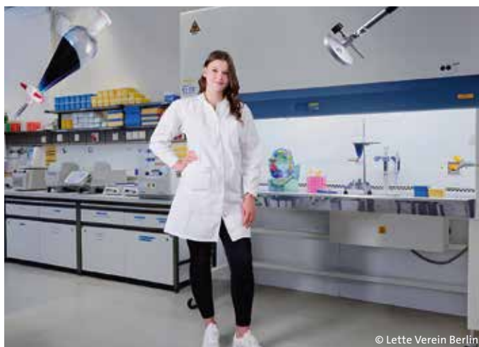
Technischer Assistent oder Technische Assistentin für chemisch-biologische Laboratorien ist ein Ausbildungszeitpunkt beim Lette Verein.

Bis heute konzentriert sich der „Lette Verein Berlin“, längst umgewandelt in eine Stiftung des öffentlichen Rechts, auf Ausbildungen in den Bereichen Naturwissenschaft, Technik, Gesundheit, Ernährung und Versorgung sowie Design. Das bedeutet auch, dass sieben Schulen unter einem Dach vereint betrieben werden. Zwar sind 37 Prozent der etwa 700 Schüler und Auszubildenden männlich, „aber wir verstehen uns als Einrichtung, die Frauen fördert“, unterstreicht Madyda, die zunächst Lehrerin und Schulleiterin war, bevor sie die Leitung des Hauses übernahm.