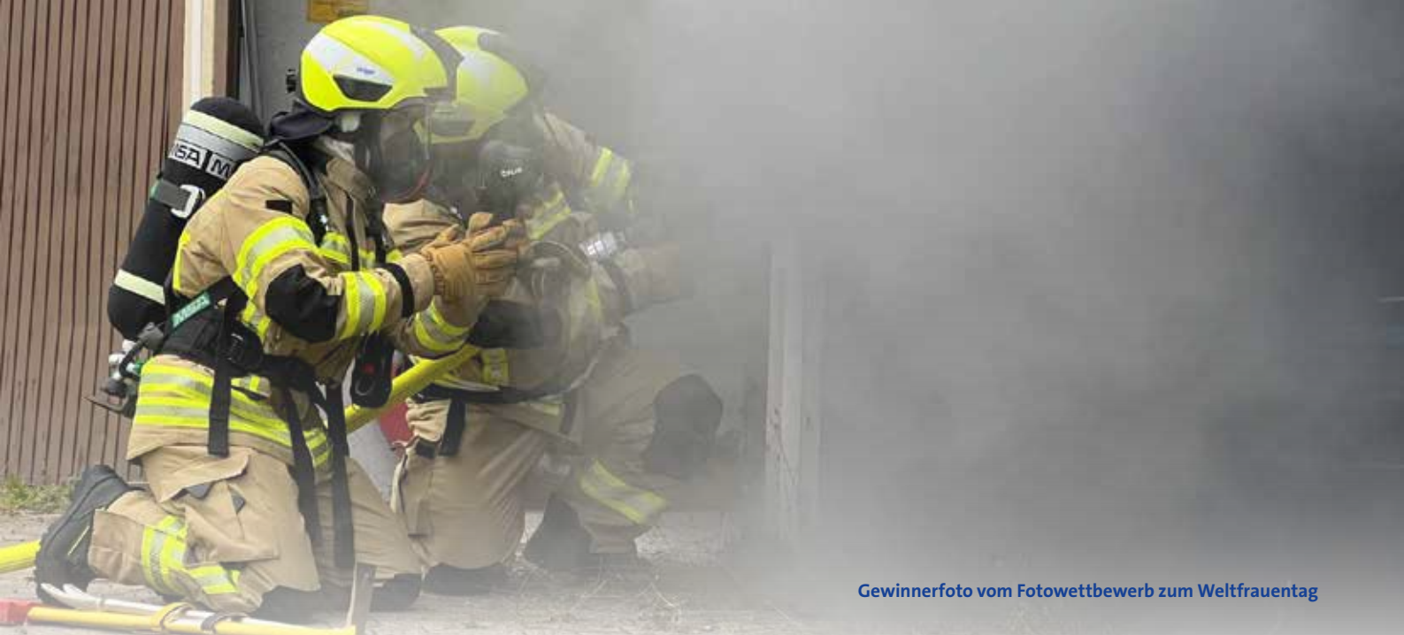
Gewinnerfoto vom Fotowettbewerb zum Weltfrauentag