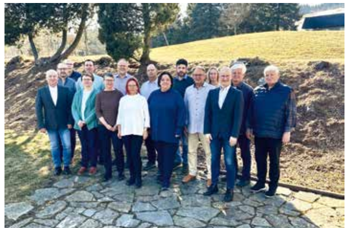
Bereichsvorstand mit den StOGrp.-Vorsitzenden