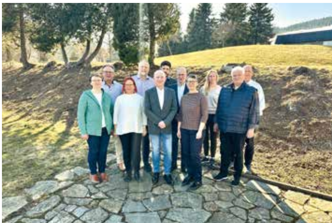
Bereichsvorstand Bereich VII