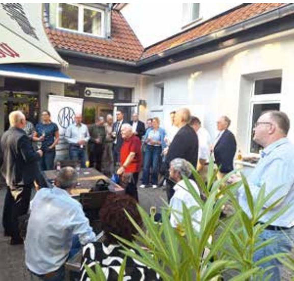
Haus Müllestumpe – Außenansicht und Sektempfang