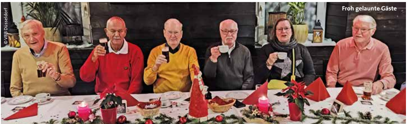
Froh gelaunte Gäste