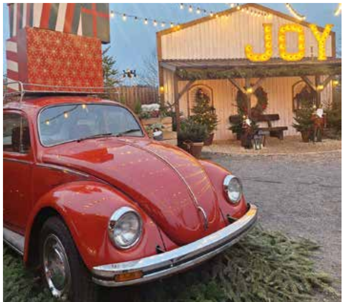
Impressionen des Weihnachtsumtrunks