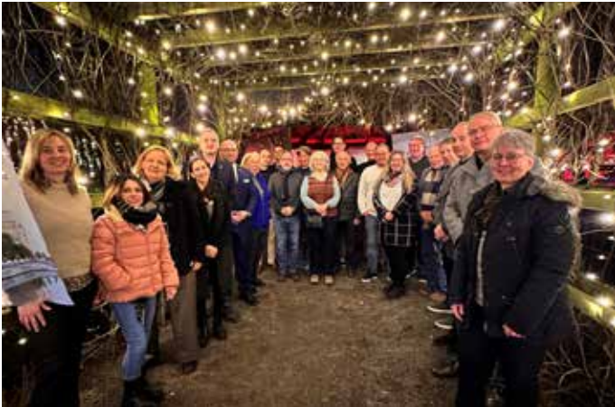
Gruppenfoto der Standortgruppe Hürth