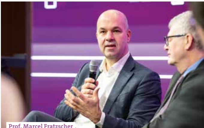
Prof. Marcel Fratzscher