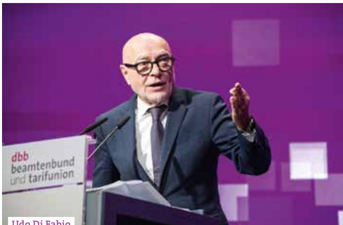
Udo Di Fabio