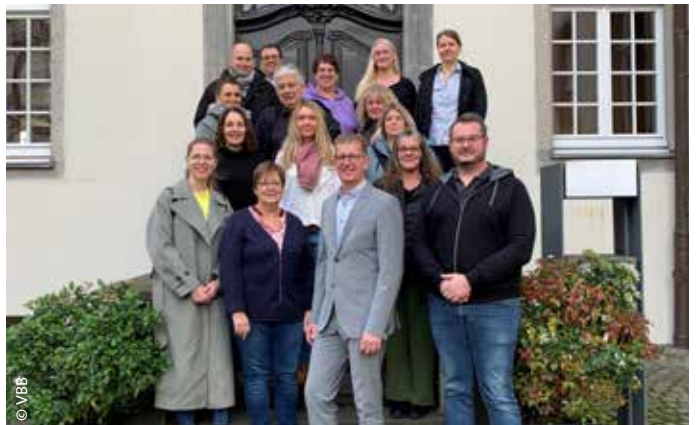
Gruppenfoto der Seminarteilnehmer

Darüber hinaus bot sich abends die Gelegenheit, den mittelalterlichen Weihnachtsmarkt in Siegburg zu besuchen. Abschließend bleibt festzustellen, dass es ein sehr erfolgreiches Seminar war und mit dieser Thematik wieder angeboten werden sollte.