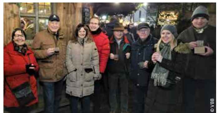
Mitglieder der Standortgruppe Landsberg/Lechfeld auf dem Landsberger Weihnachtsmarkt

Die Teilnehmer empfanden das Treffen als eine angenehme Abwechslung im Vorweihnachtstrubel und regten eine Wiederholung im Jahr 2025 an.