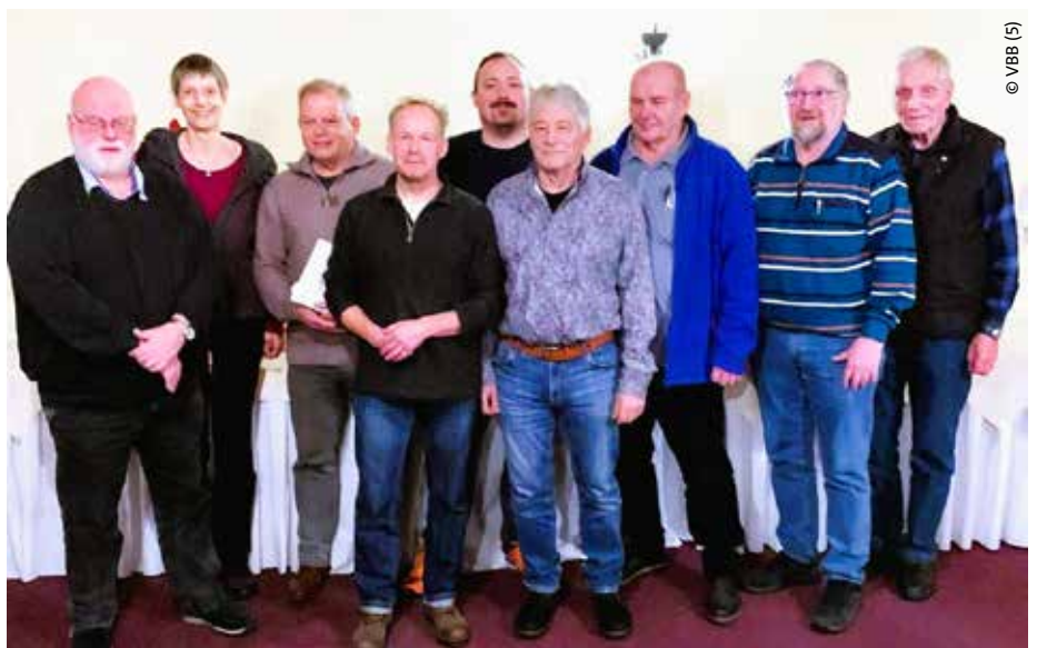
Alle geehrten Mitglieder der StOGrp. Bremerhaven