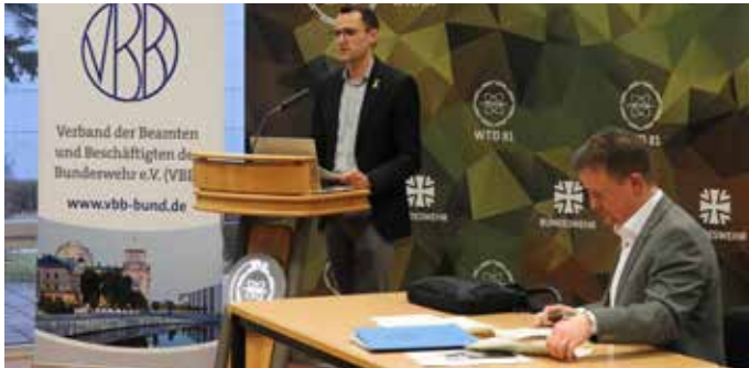
Bericht des Kassenwarts Vroemen

spricht Stillstand von Verhandlungen wichtiger Punkte, da nicht sichergestellt ist, ob die jeweiligen Ansprechpartner gleichbleibend sein werden.