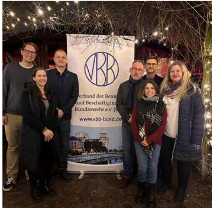
Der Vorstand der Standortgruppe Hürth