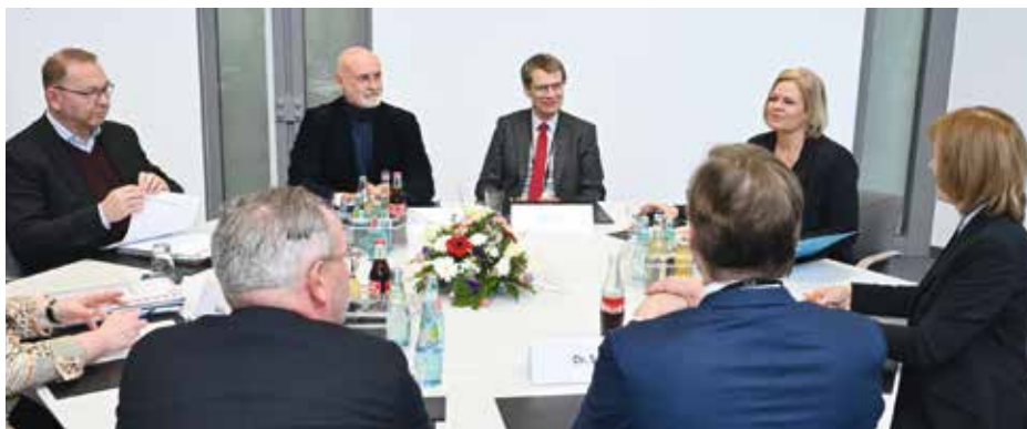
Auftakt ohne Angebot: Die Gewerkschaften stellen sich auf zähe Verhandlungen ein.

kritisierte Geyer nach Ende der Gespräche und unterstrich den Anspruch der Beschäftigten auf spürbare Einkommenszuwächse: „Die Finanzausstattung der Kommunen ist nicht aufgabengerecht. Daran sind aber nicht die Kolleginnen und Kollegen