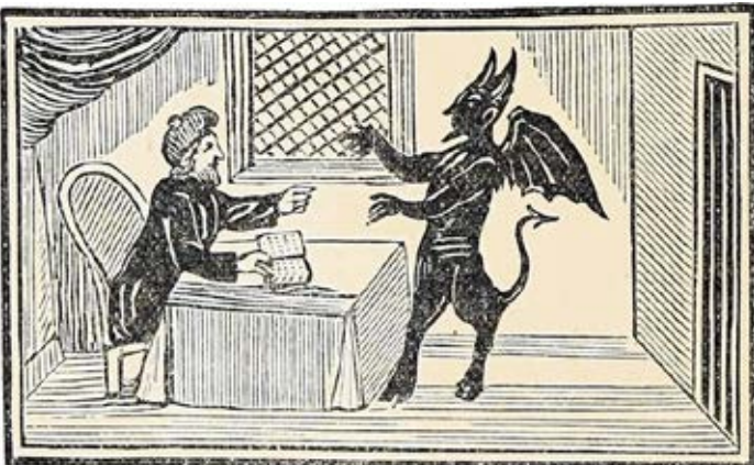
Holzschnitt: Künstler unbekannt