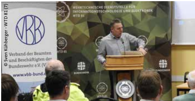
Rede Zeller, Vertreter LV Bayern