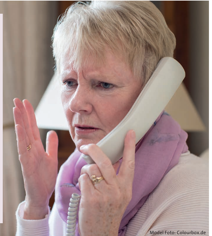
Model Foto: Colourbox.de

Über drei Millionen Pflegebedürftige werden in Deutschland zu Hause von ihren Angehörigen versorgt. In vielen Fällen wohnen die Angehörigen in der Umgebung oder sogar im selben Haus. Das erleichtert die Logistik rund um die Fürsorge. Aber wenn die Angehörigen mehrere Hundert Kilometer entfernt wohnen?