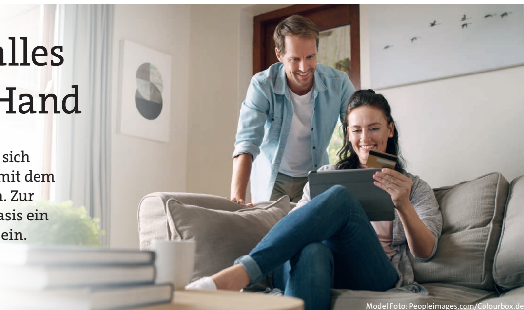
Model Foto: Peopleimages.com/Colourbox.de