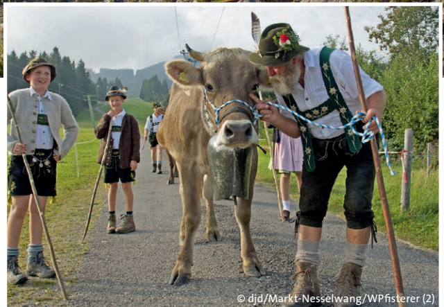
Zum Vihscheid treiben die Hirten bei der Alpspitzbahn ihre geschmückten Tiere ins Tal.

Die Alpspitzbahn fährt bis zum 3. November auf 1500 Meter hinauf und punktet bei Familien auch mit ihren actionreichen Bergerlebnissen. Zu der rasanten Rodelbahn und der schnellsten Zipline Deutschlands kommt in dieser Saison noch eine neue Attraktion hinzu: „Alpspitz-SPLASH“ ist weltweit der erste schwim-