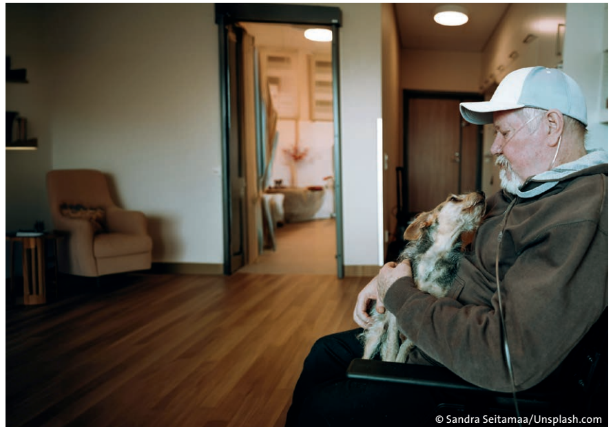
Viele Senioren wünschen sich Pflege zu Hause statt im Pflegeheim.

Gleichzeitig wünschten sich diejenigen, die die Angebote nutzen, mehr davon: Mehr Hilfe bei der „Körperpflege, Ernährung und Mobilität“ wünschten sich 2023 62,5 Prozent, 2019 waren es noch 49 Prozent. 2023 wünschten sich 59 Prozent „Hilfe bei der Füh-