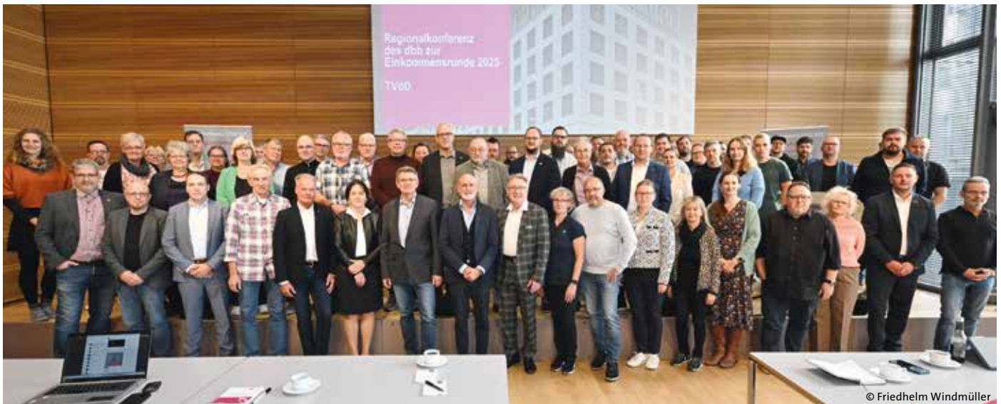
Teilnehmerinnen und Teilnehmer der Regionalkonferenz am 30. September 2024 in Berlin.

Mehr Flexibilität, mehr Entlastung, mehr Geld: Die Beschäftigten haben dezidierte Vorstellungen davon, was sich ändern muss. Sie haben ihre Wünsche im Vorfeld der Forderungsfindung für die anstehende Einkommensrunde auf den dbb Regionalkonferenzen mit Vertretern der dbb Spitze diskutiert, zuletzt am 1. Oktober in Hamburg.