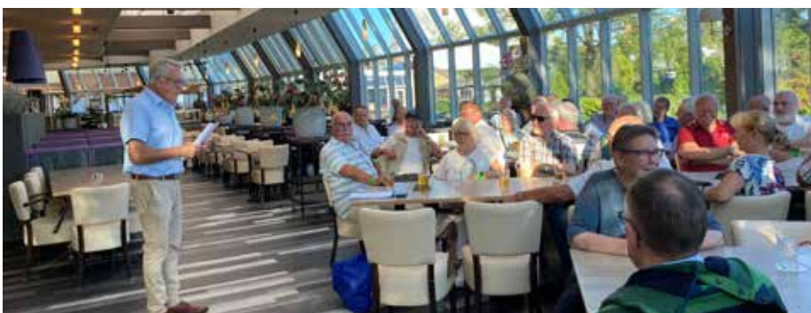
Seminarteilnehmer und Gäste