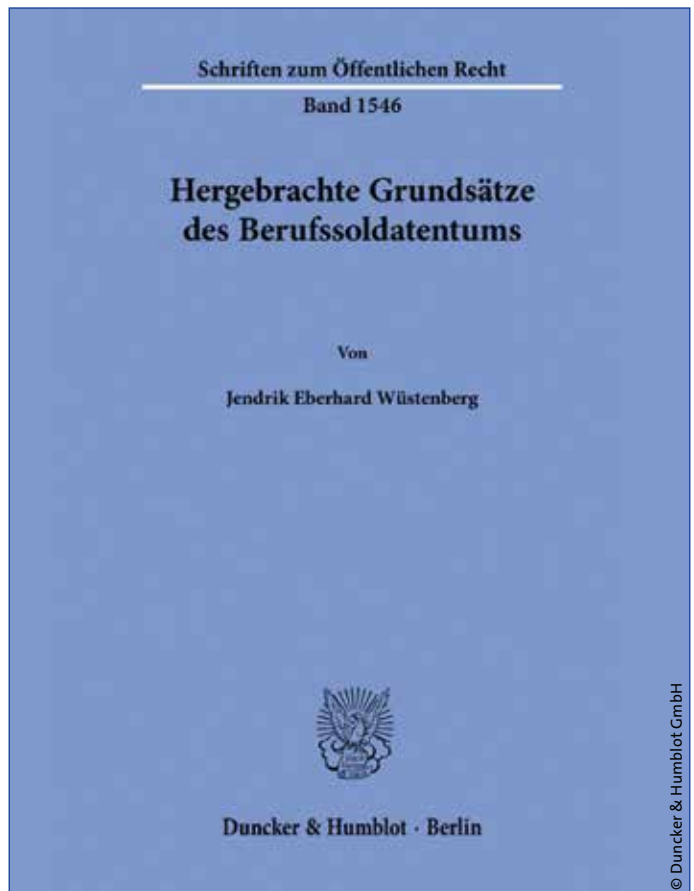
Herbrachte Grundsätze des Berufssoldatentums

Der Autor leitet aus dem erweiterten Anwendungsbereich des Art. 33 Abs. V GG in zutreffender Weise keine Angleichung der unterschiedlichen Statusgruppen der Beamten, Richter und Soldaten ab. Er äußert auf Seite 117 sogar die Annahme, dass die Trennung von kämpfender Truppe und ziviler Verwaltung in den Art. 87a, 87b GG ein die Epochen übergreifendes Prinzip sei. Das mag zwar grundsätzlich zutreffen, die Grenzen werden jedoch zunehmend verwischt. Auch der Autor stellt auf Seite 152 fest, dass die Anzahl von Soldaten auf sogenannten Wechseldienstposten zunimmt.