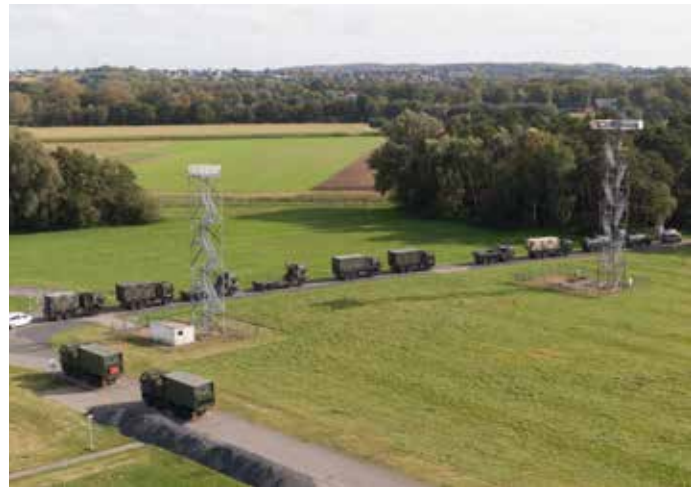
Ausfahrt Konvoi, Aufnahme mit der Drohne