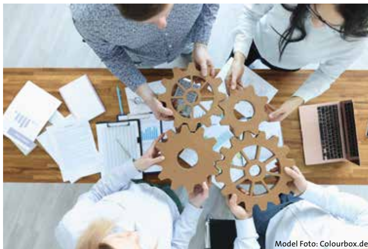
Model Foto: Colourbox.de