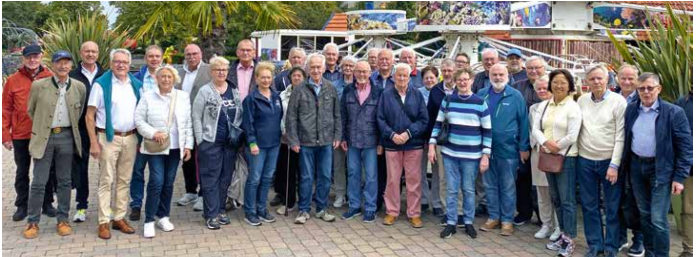
VBB-Seniorengruppe mit Gästen

Das diesjährige Bundesseniorensseminar fand turnusgemäß im Bereich III NRW in Kalkar am Niederrhein in der Zeit vom 9. bis 11. September 2024 statt. Organisation der Tagungsstätte und das Rahmenprogramm lagen in den Händen des VBB-Bereichs III Nordrhein-Westfalen.