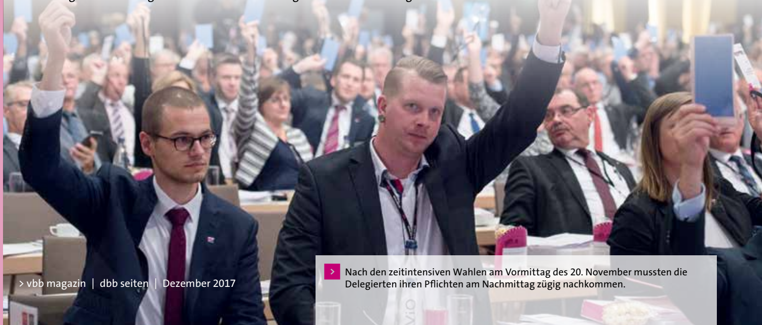
> Nach den zeitintensiven Wahlen am Vormittag des 20. November mussten die Delegierten ihren Pflichten am Nachmittag zügig nachkommen.

Weitere Leitanträge an den Gewerkschaftstag des dbb befassten sich mit der Stärkung von Justiz und Finanzverwaltung, flexiblen Arbeitsformen im öffentlichen Dienst, der konstruktiven gewerkschaftlichen Begleitung von E-Government-Prozessen, der Steigerung der Attraktivität sozialer Berufe sowie mit Positionen zum Arbeits- und Gesundheitsschutz, zur Sozialpolitik, zum Arbeitsrecht und zur europäischen Ausrichtung.