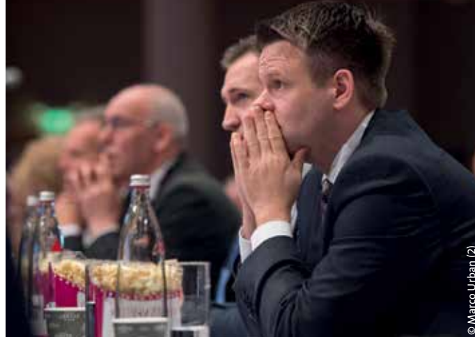
> Über die Anträge wurde, wenn möglich, en bloc entschieden.

Im Leitantrag „Positionen zum Dienstrecht“ spricht sich der dbb für einen einheitlichen, ungeteilten Beamtenstatus aus und lehnt eine Relativierung durch Aufspaltung in Dienstverhältnisse mit unterschiedlichen Gestaltungsrechten je nach übertragener Aufgabe ab. Das Streikverbot als tragende Säule