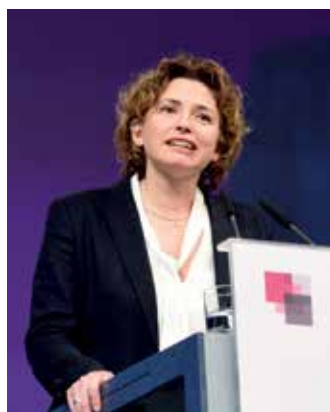
> Nicola Beer

fert der öffentliche Dienst mit seinen Beschäftigten. Er trägt maßgeblich dazu bei, dass wir ein leistungsstarkes und lebenswertes Land sind“, so Beer. Die Verwaltung sei eine verlässliche Konstante, die es im demokratischen Grundverständnis auch ermögliche, Deutschland eine Phase der politischen Neuorientierung unbeschadet überstehen zu lassen. Sie sei für einen starken Staat, wenn er nicht zum ausufernden Staat werde, der Bürgerinnen und Bürger behindere. Auswüchse der Überregulierung dürfe es auch im Sinne des Dienstes am Menschen nicht geben.