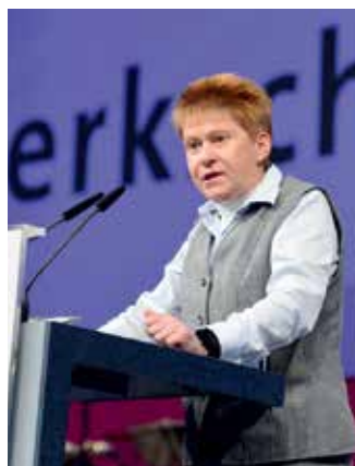
> Petra Pau

Die Bundestagsvizepräsidentin und Linken-Politikerin Petra Pau hob hervor, dass ihre Fraktion mit dem dbb zwar beim Tarifeinheitsgesetz und der Bürgerversicherung keinen Konsens pflege: „Wenn ich alle