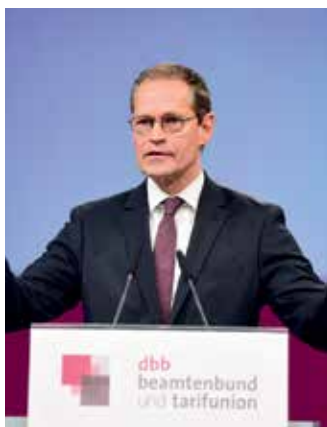
> Michael Müller

worden, dass diese gewaltige Aufgabe trotz des großen ehrenamtlichen Engagements nur durch eine gut funktionierende und leistungsbereite Verwaltung habe bewältigt werden können. Dennoch sei ein neues Miteinander wünschenswert, so der amtierende Bundesratspräsident: „Die Bürger erwarten eine funktionierende Verwaltung. Die muss kein Kumpel sein, aber Nähe und Vertrauen sind heute unerlässlich. Die Bürger wollen mitentscheiden.“ Dafür müsse der öffentliche Dienst entsprechend ausgestattet werden.