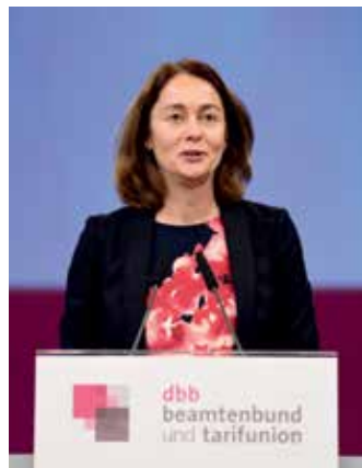
> Katarina Barley