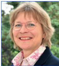
Imke v. Bornstaedt-Küpper Bundesvorsitzende

Die Bundesleitung, der Bundesvorstand und die Bundesgeschäftsstelle stehen Ihnen gerne zur Verfügung!